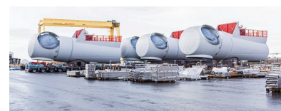
Diese Windkraftanlagenteile liegen in Cuxhaven, geliefert werden sie aber nach England